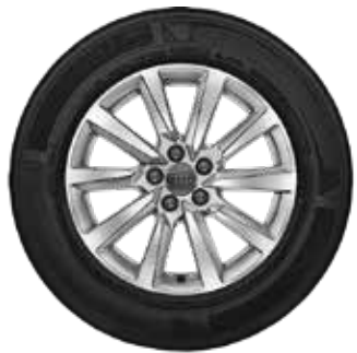
1 10-lúčový dizajn