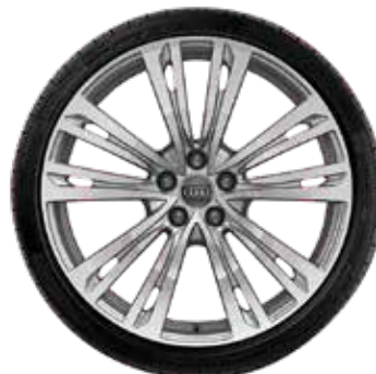
37 10-paralelných lúčov-dizajn