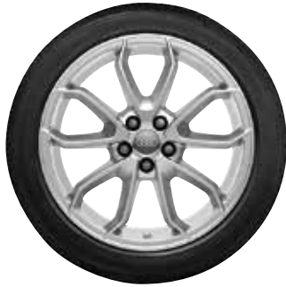
3 5-ramenný Carabus dizajn