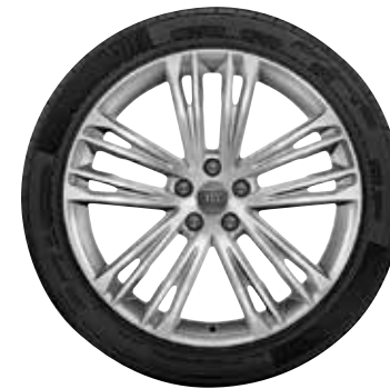
34 5-dvojitých lúčov-V-dizajn