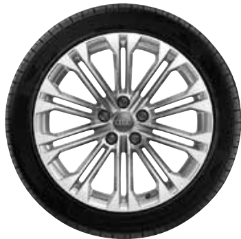
18 10-paralelných lúčov-dizajn