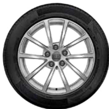
23 10-lúčový dizajn

Naskenujte QR kód a zobrazte online informácie.