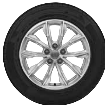
51 10-lúčový dizajn