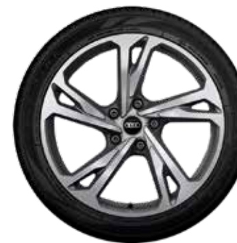
75 5-dvojitých lúčov-dizajn