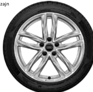
12 5-dvojitých lúčov-dizajn