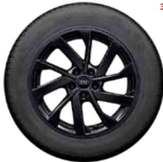
2 10-lúčový turbínový dizajn