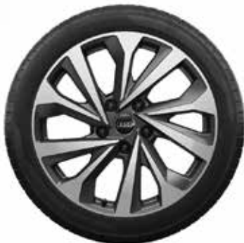
56 5-dvojitých lúčov-Dynamic-dizajn