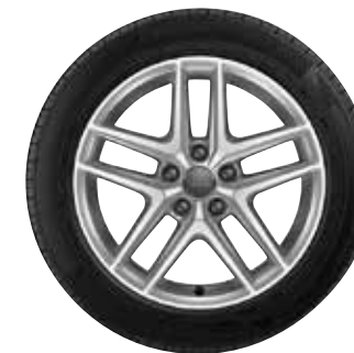
15 5-paralelných lúčov-V-dizajn