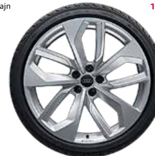
14 5-dvojitých lúčov-Edge-dizajn