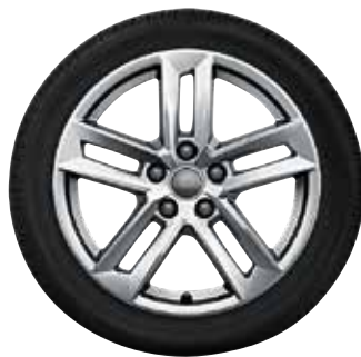
11 5-paralelných lúčov-dizajn