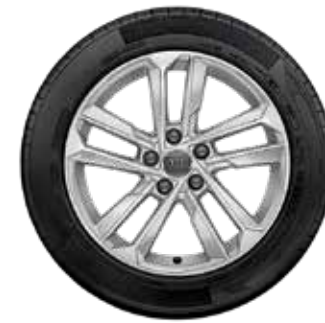
7 5-paraalelných lúčov-dizajn